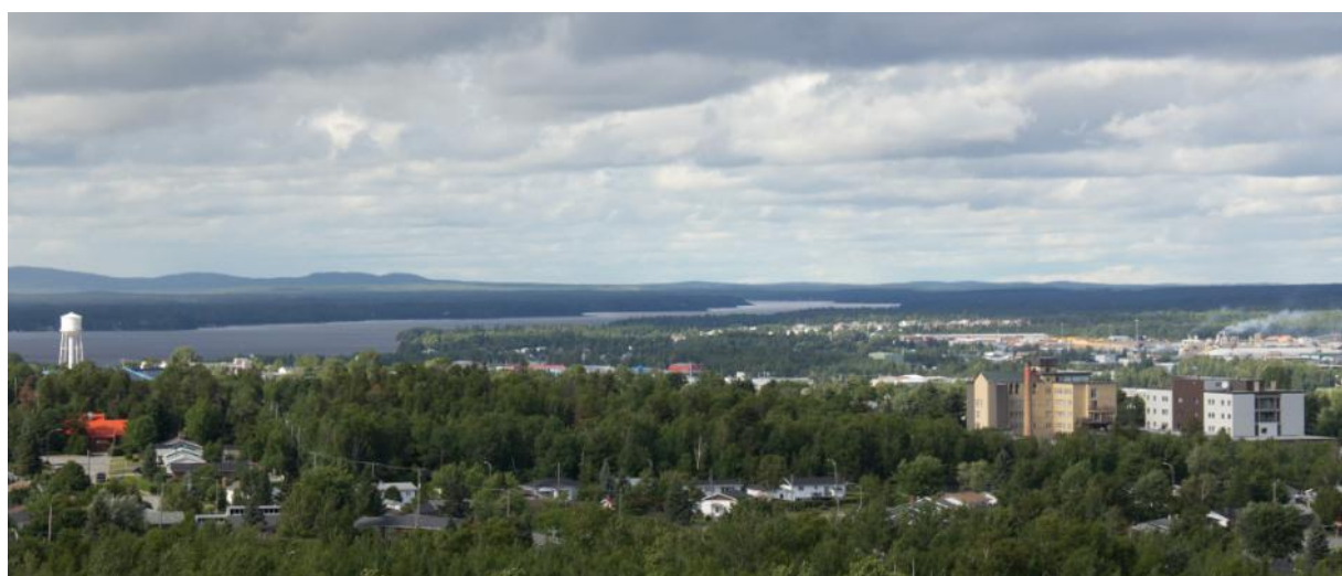
Ville de Val-d'Or

Depuis quelques années, la rareté du personnel de la santé se fait sentir. C'est ce qui explique l'engouement réciproque des services de santé québécois à l'égard des infirmiers et infirmières formés à l'étranger, notamment de France et de Belgique. C'est encore plus vrai dans les régions comme l'Abitibi-Témiscamingue, qui offrent pourtant un cadre de vie exceptionnel.